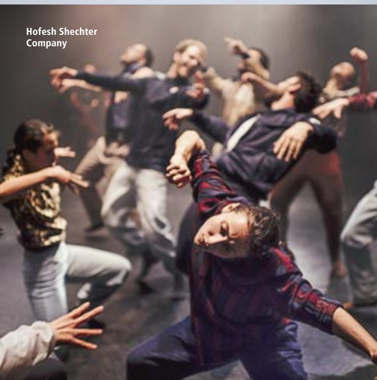
Hofesh Shechter Company