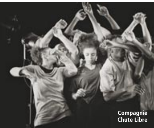
Compagnie Chute Libre

Heerlen: In Zusammenarbeit mit / In samenwerking met Huis voor de Kunsten Limburg