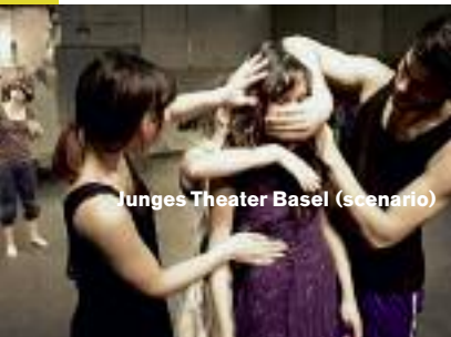
Junges Theater Basel (scenario)