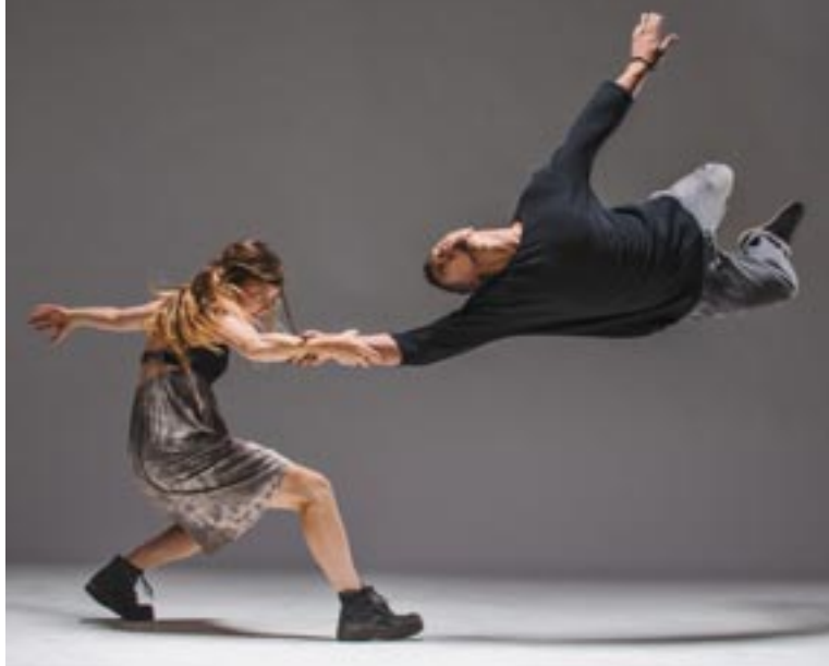
Delfos Danza Contemporánea