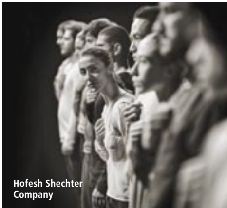
Hofesh Shechter Company

Sa / za 03.03.2018 12.00 – 14.00 Uhr / uur VHS Aachen (hogeschool), Raum / kamer 233, Peterstr. 21-25, 52062 Aachen / Aken 25,00€ Teilnehmergebühr/ Kosten van deelname Anmeldung unter / aanmelden via: T.: +49(0)241-4792111, unter Angabe der Veranstaltungs-Nr. / o.v.v. het nummer: 181- 09102