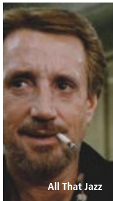
All That Jazz