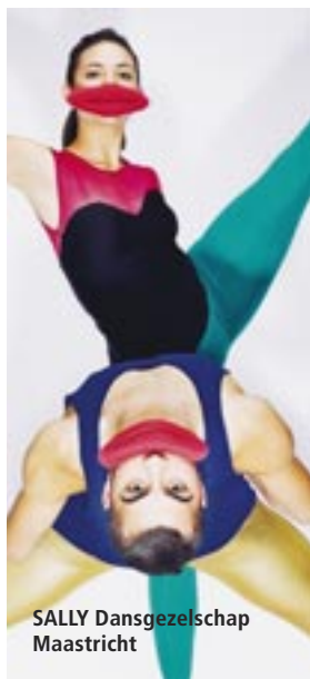
SALLY Dansgezelschap Maastricht

So / zo 11.03.2018 17.00 Uhr / uur Ludwig Forum Aachen