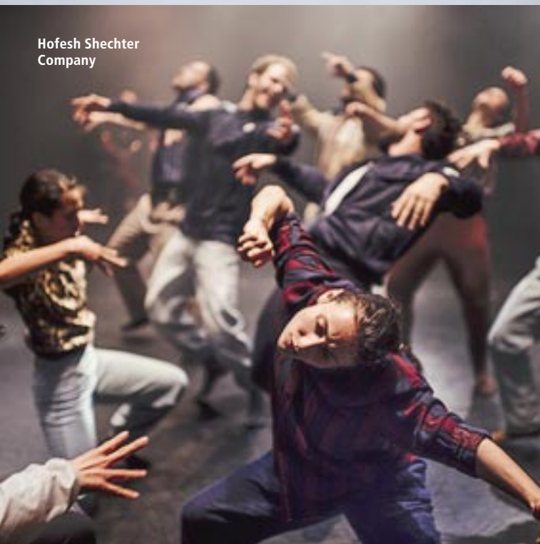
Hofesh Shechter Company