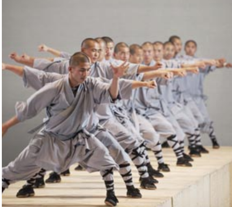
Sidi Larbi Cherkaoui