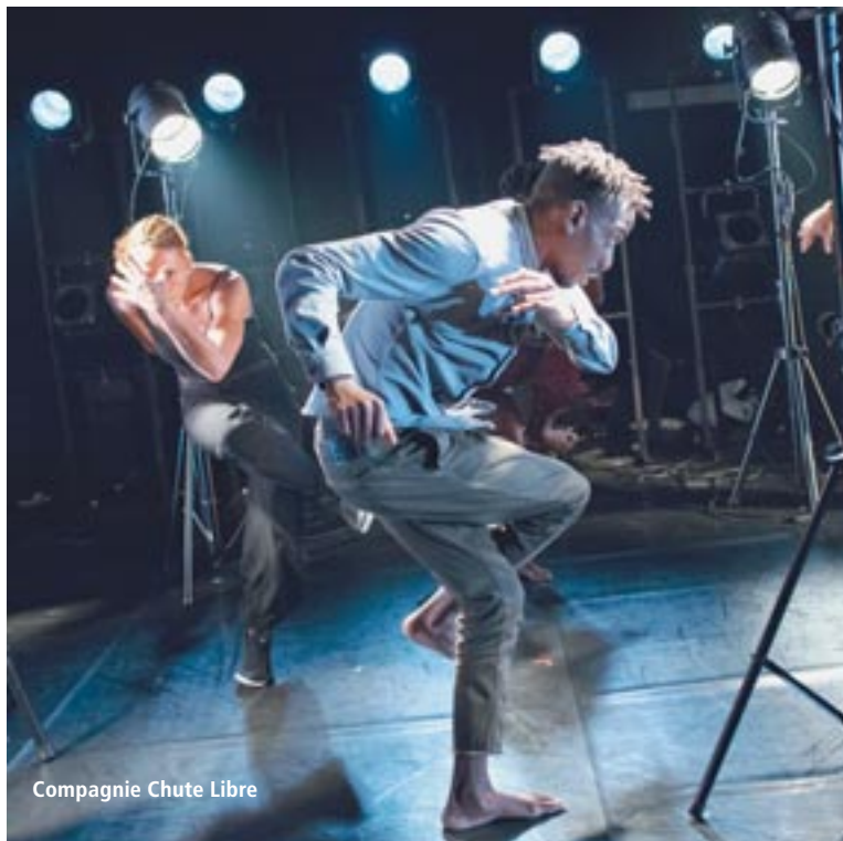
Compagnie Chute Libre