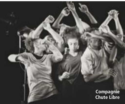
Compagnie Chute Libre

Heerlen: In Zusammenarbeit mit / In samenwerking met Huis voor de Kunsten Limburg