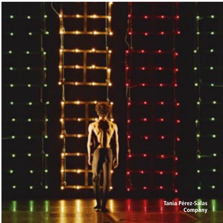
Tania Pérez-Salas Company

Mit dem 23. schrit_tmacher Festival steht unsere Region wieder voll und ganz im Zeichen des internationalen zeitgenössischen Tanzes. Ein ausgedehntes Abendprogramm in der Aachener Fabrik Stahlbau Strang und im Theater Heerlen sowie weitere spannende Akzente im Alten Schlachthof Eupen, im SCHUNCK* und im Ludwig Forum Aachen bieten dem Festivalpublikum ein breites Spektrum an Tanzdarbietungen, Sprachen und Stilen.